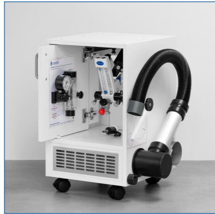
Med 4 låsbara hjul