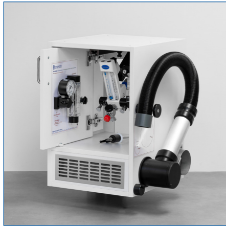
Hängande under bänkskivan

ALL IN ONE kan placeras enligt följande: